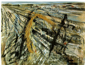
Anselm Kiefer, Dit askegrå hår, Sulamith , 1981