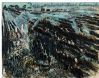
Anselm Kiefer, Dit gyldne hår, Margaretha , 1981